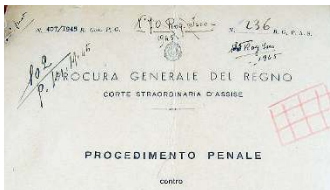
Intestazione. Il fascicolo processuale di un milite della Legione Tagliamento

stanziale continuità che si registrò alla fine del processo di epurazione. Come avevano temuto, a pagare la compromissione col fascismo erano stati per lo più i pesci piccoli, mentre i grandi erano in larga parte riusciti a sfuggire dalla rete. Nel collasso delle istituzioni seguito alla caduta della dittatura era del resto arduo governare un processo del genere. Ancor più arduo alla luce dell'allarme che esso suscitava nelle forze moderate. In un Paese irregimentato dal partito unico, erano milioni gli italiani che temevano di venire accusati di connivenza, o comunque di condiscendenza, col fascismo. «L'Uomo qualunque» con la sua polemica contro l'antifascismo, che descriveva non meno intollerante del fascismo, ne raccoglieva copiosi frutti. I liberali vedevano assottigliarsi il loro seguito.